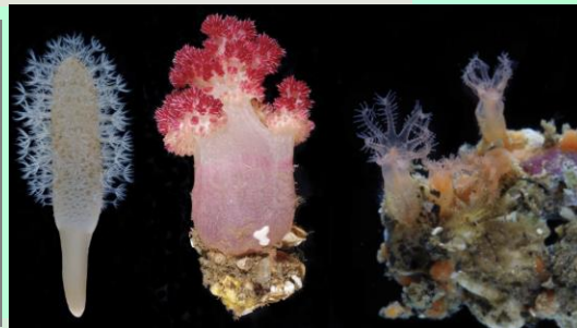
八放サンゴ類の生物学