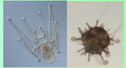
海産動物の生活史