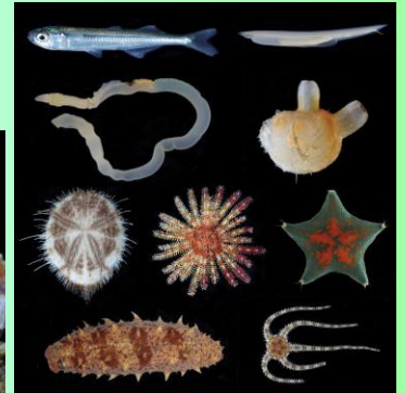
新口動物の 比較形態学

令和6年3月13日(水)～17日(日) お茶の水女子大学 湾岸生物教育研究所 (千葉県館山市)